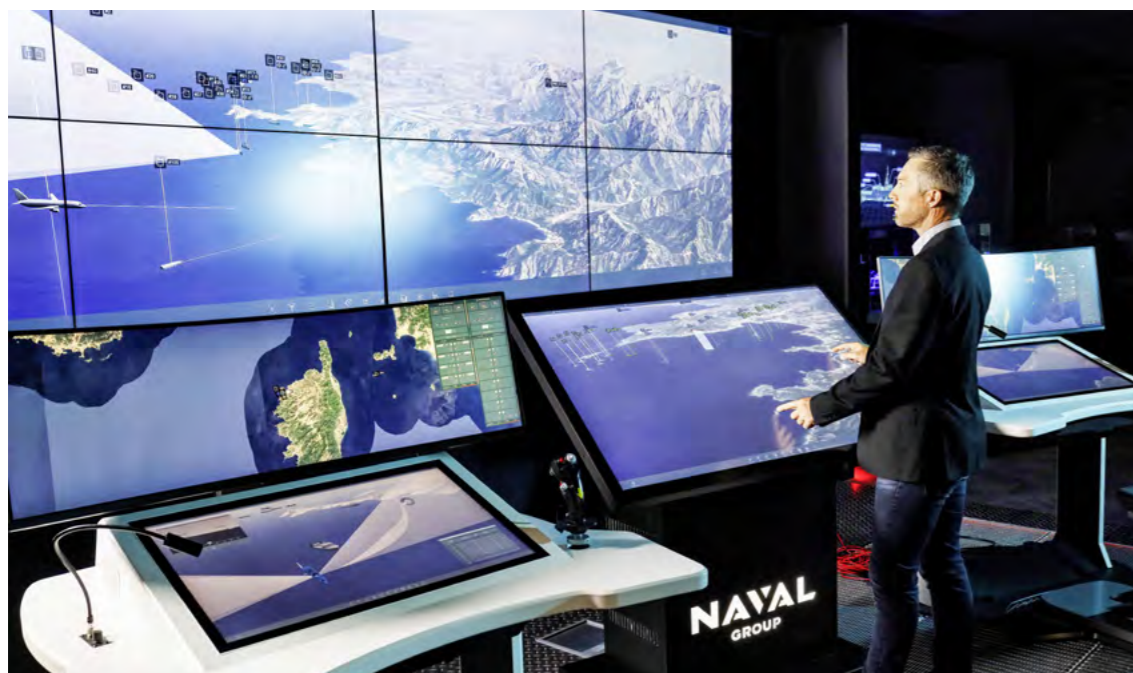
Setis® : le système de combat pour les opérations navales de haute intensité.