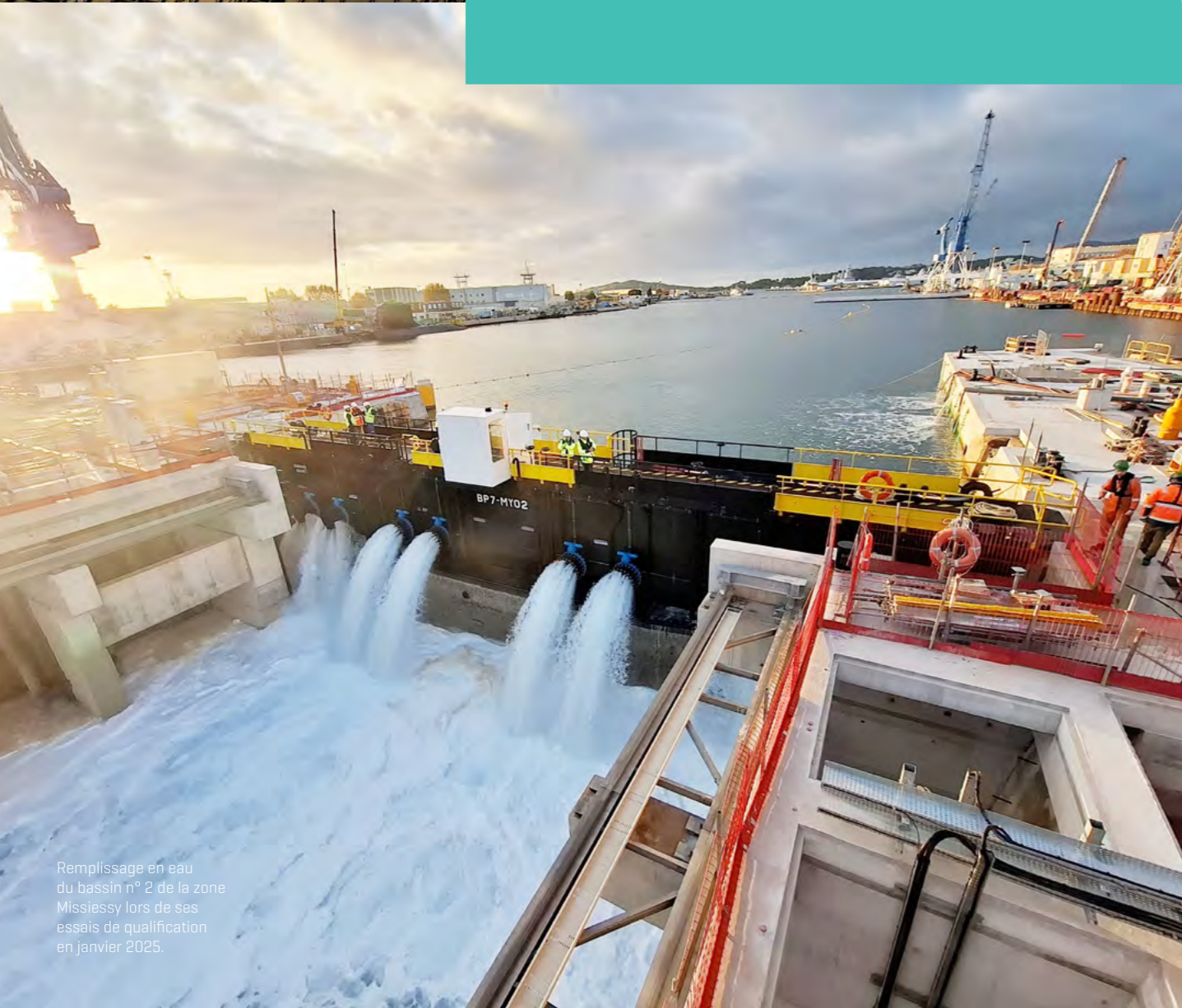
Remplissage en eau du bassin n° 2 de la zone Missiessy lors de ses essais de qualification en janvier 2025.

Le SID a confié à Naval Group différentes missions en fonction de l'avancement du chantier global. Le montage industriel et l'organisation des tâches ont évolué avec le projet : très demandeuse en effectifs côté Naval Group, la phase 1 a mobilisé des collaborateurs sur la partie études puis sur la réalisation des travaux. Sur la phase 2, Naval Group assure la maîtrise d'œuvre des travaux pour le bassin 2. Naval Group a également réalisé une partie des études de conception pour le bassin 3. Phase de lancement et de développement d'un projet extrêmement complexe, la phase 1 est à juste titre celle qui a été la plus difficile : en 2012, le niveau d'expertise de Naval Group en infrastructures n'était pas celui désormais atteint. Il a fallu aussi apprendre à nous connaître, à parler le même langage. Des ajustements ont été effectués – notamment sur l'apport technique –, et les bénéfices ont été visibles et ressentis en phase 2. Nous avons assisté à une réelle montée en compétences, boostée par la volonté sans faille des équipes de Naval Group. Ensemble, nous avons atteint un plus haut niveau de confiance. Ce qui nous lie d'autant plus, c'est la mission commune qui nous anime chaque jour : assurer coûte que coûte la disponibilité des SNA tout en réalisant un chantier hors norme.