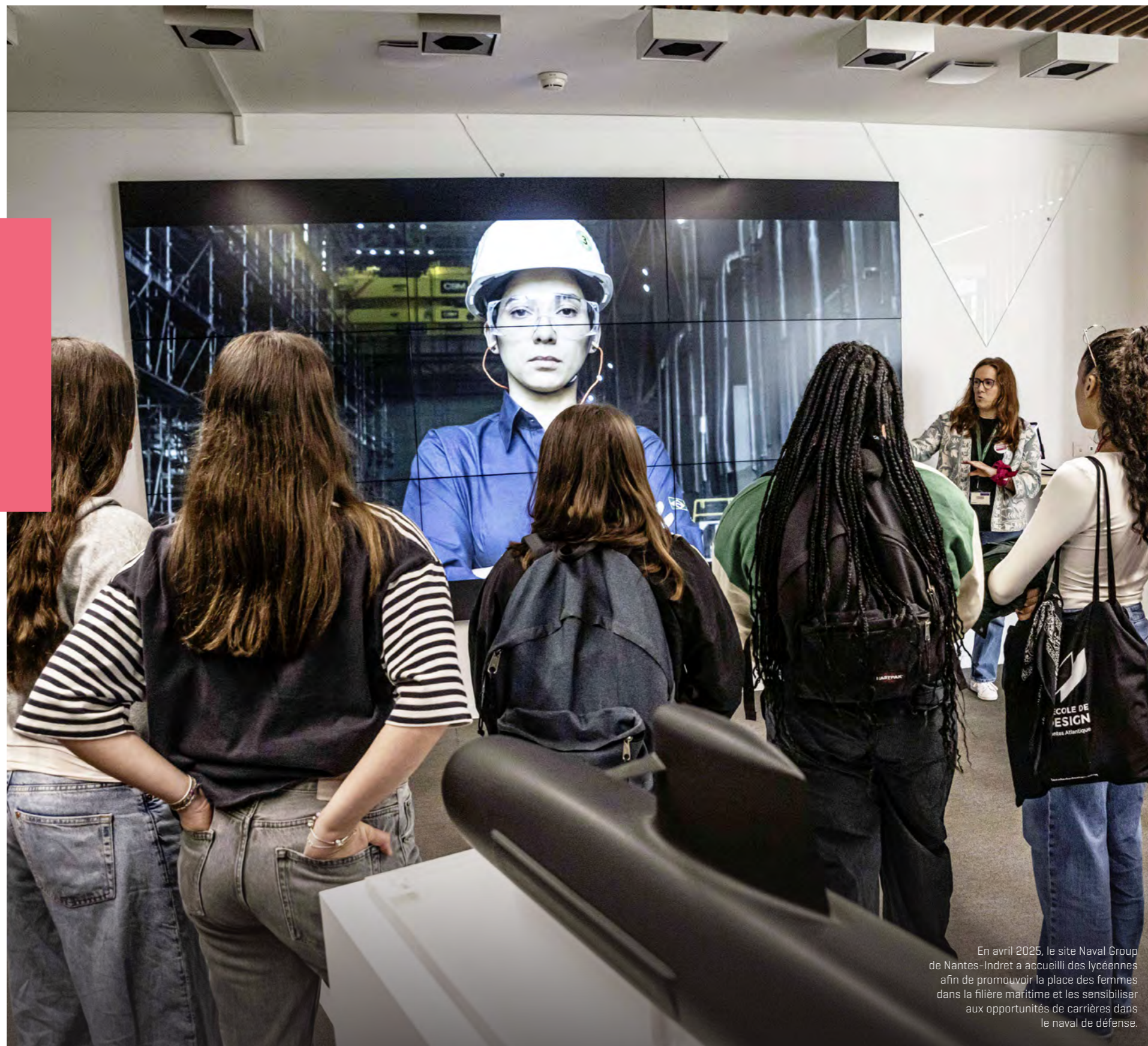
En avril 2025, le site Naval Group de Nantes-Indret a accueilli des lycéennes afin de promouvoir la place des femmes dans la filière maritime et les sensibiliser aux opportunités de carrières dans le naval de défense.