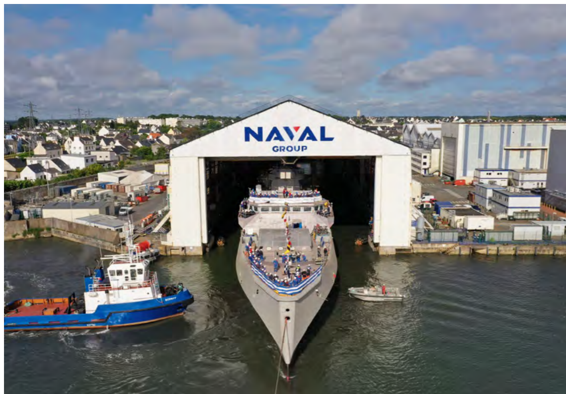
Formion , la troisième frégate de défense et d'intervention (FDI) pour la marine hellénique, a été mise à flot le 28 mai sur le site Naval Group de Lorient.

Naval Review Direction de la Communication : 40-42, rue du Docteur Finlay, 75732 Paris Cedex 15. Directrice de la Communication : Véronique Page – Rédactrice en chef : Clara Nauche – Rédaction : Laure Buquet, Katia Fau, Charlotte Jouenne-Cohen, Claire Ménager – Conception et réalisation : BABEL – ISSN en cours – Magazine diffusé à 10 000 exemplaires. La démarche de Naval Group pour le respect de l'environnement commence par le choix du papier de Naval Review , imprimé sur papier 100 % recyclé.