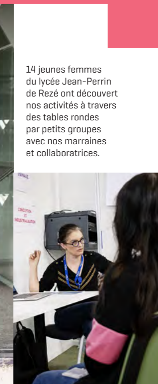
14 jeunes femmes du lycée Jean-Perrin de Rezé ont découvert nos activités à travers des tables rondes par petits groupes avec nos marraines et collaboratrices.