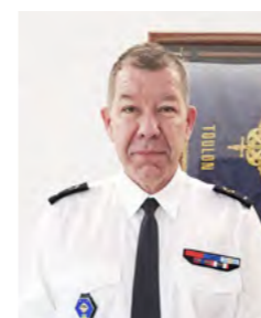
GÉNÉRAL PIERRE-JEAN RONDEAU

Expert en matière d'infrastructure et d'énergie du ministère des Armées, le Service d'infrastructure de la Défense (SID) a pour mission de répondre aux besoins en infrastructure des forces en tout temps et en tous lieux. Il pilote les opérations de construction, de rénovation et de maintien en condition des installations. Maître d'ouvrage du chantier Missiessy, SID MED a fait confiance à Naval Group.